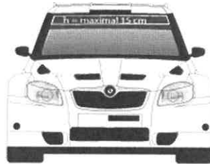
FRONTSCHIEBE LT. ARTIKEL 18.7.4 national